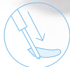
Pedane estraibili Removable footrests