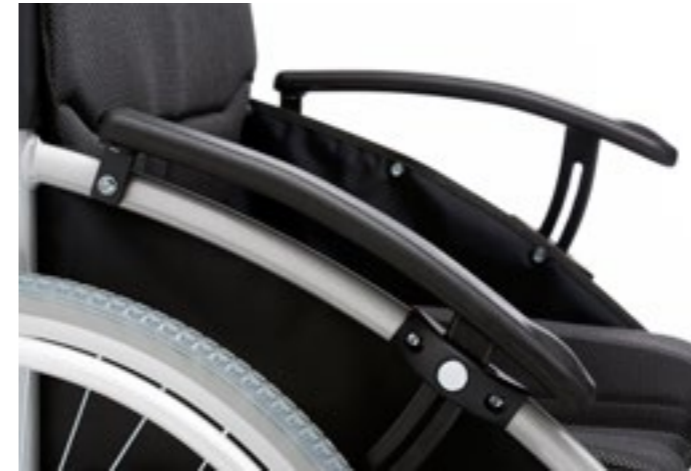
Bracciolo richiudibile a compasso Armrest with compass closing